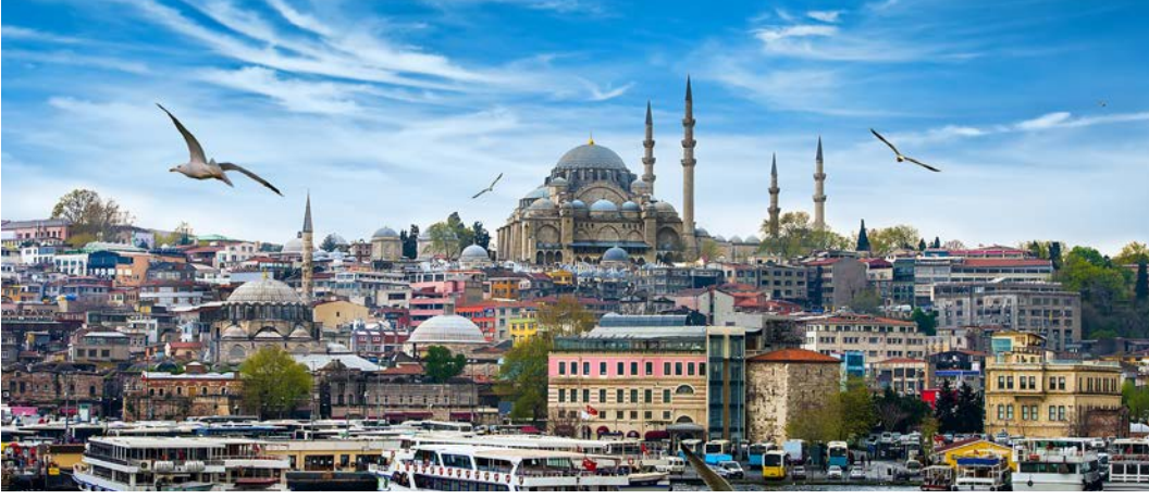
Görsel 2.11: Birçok etkinliğe ev sahipliği yapan İstanbul

2019 yılından bu yana Türkiye'de düzenlenen İstanbul Fringe Festivali, dünyadan ve Türkiye'den performans sanatları alanında üretilen çalışmaları seyirciyle buluşturmayı hedefleyen bir uluslararası performans sanatları festivalidir. İstanbul Film Festivali ise 1973 yılından bu yana gelişerek düzenlenmeye devam etmektedir. İstanbul'da düzenli olarak müzik, film, tiyatro ve caz festivalleri düzenlenmektedir (Görsel 2.11).