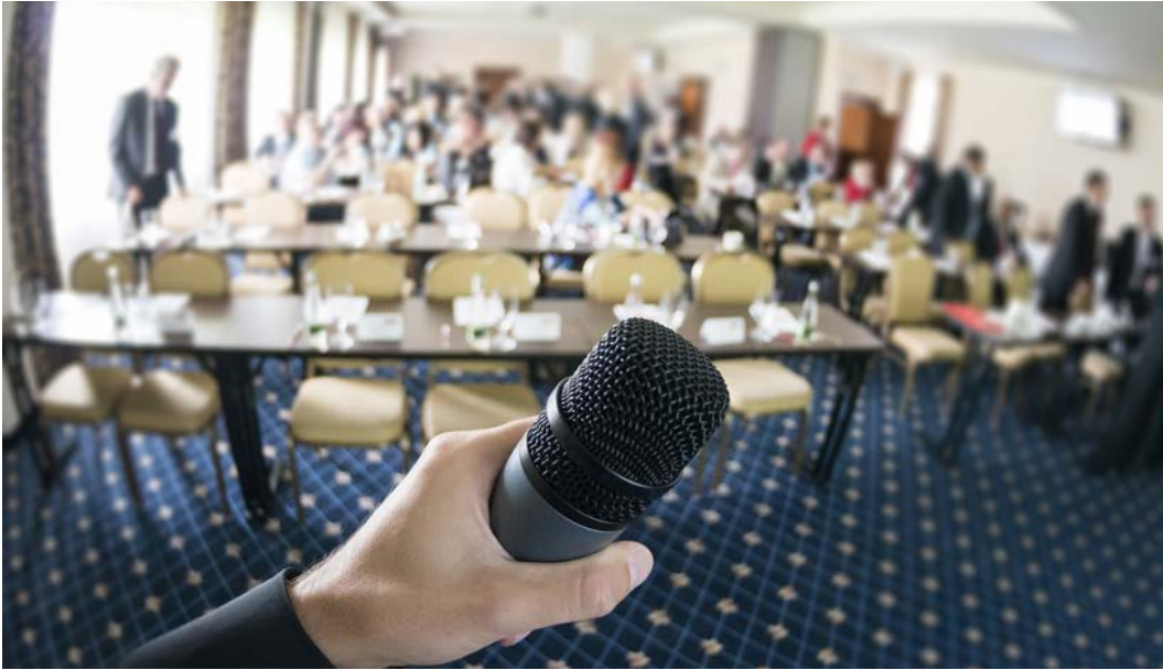
Görsel 2.30: Konseptte uygun salon