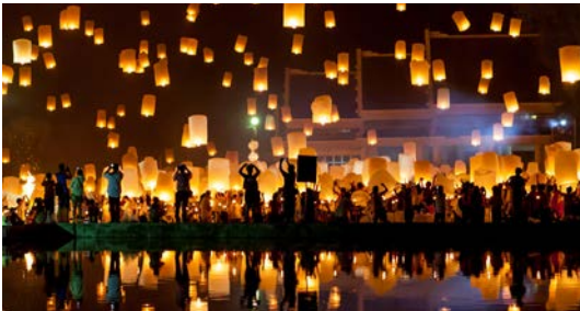
Görsel 2.5: Fener festivali, Çin