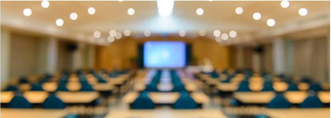
Görsel 2.29: Toplantı salonu