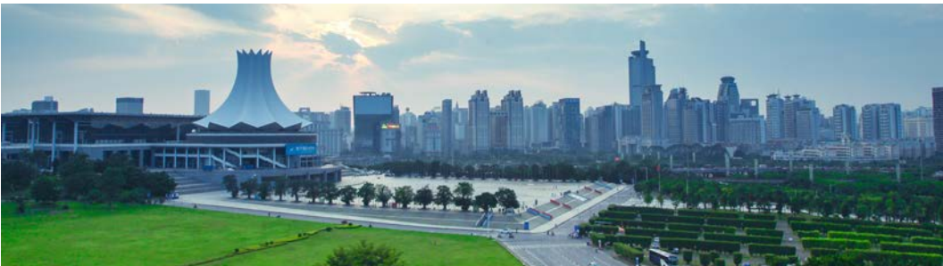
Görsel 2.3: Kongre ve sergi merkezi

Fuar ve Kongre Merkezleri: Fuar ve kongreler, bir konaklama işletmesinin bünyesinde olabileceği gibi bağımsız merkezler de olabilir. Konaklama işletmesi, bünyesinde veya bağımsız olan belli uzmanlık alanındaki toplantı ve kongrelerin düzenlenmesine imkân sağlayacak büyük binalara ve geniş alanlara sahip olmalıdır (Görsel 2.3). Böylece geniş çaplı fuar ve sergilerin düzenlenmesine olanak tanır. Bu merkezlerde genellikle geniş konser alanları, toplantı salonları ve konferans odaları bulunur. Günümüzde bu faaliyetlerin artışı nedeniyle sektörün ihtiyaç duyduğu merkezler gerek kamu gerekse özel yatırımlar aracılığı ile konaklama işletmeleri dışında bağımsız olarak kurulmuştur.