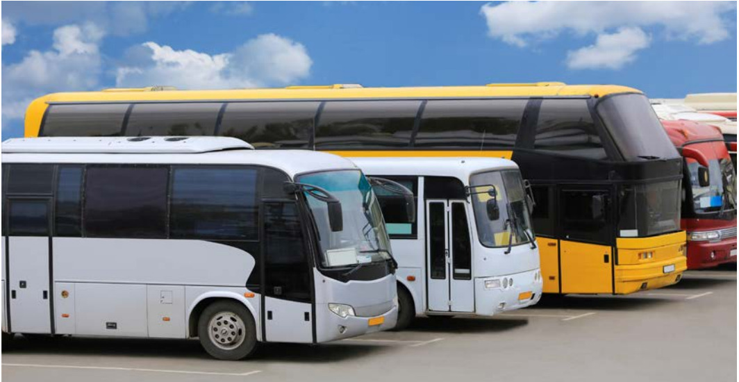
Görsel 2.24: Kafiler için kullanılan çeşitli otobüsler

Ulaşım planlaması yapılırken ne tür bir ulaşım ihtiyacı olduğunun belirlenmesi gerekir. Karşılama ulaşımı, konaklama işletmelerinden spor tesislerine ulaşım, görevliler ve diğer yardımcı personelin ulaşımı ile VIP konuklar için ulaşım planlaması doğru ve eksiksiz yapılmalıdır (Görsel 2.24).