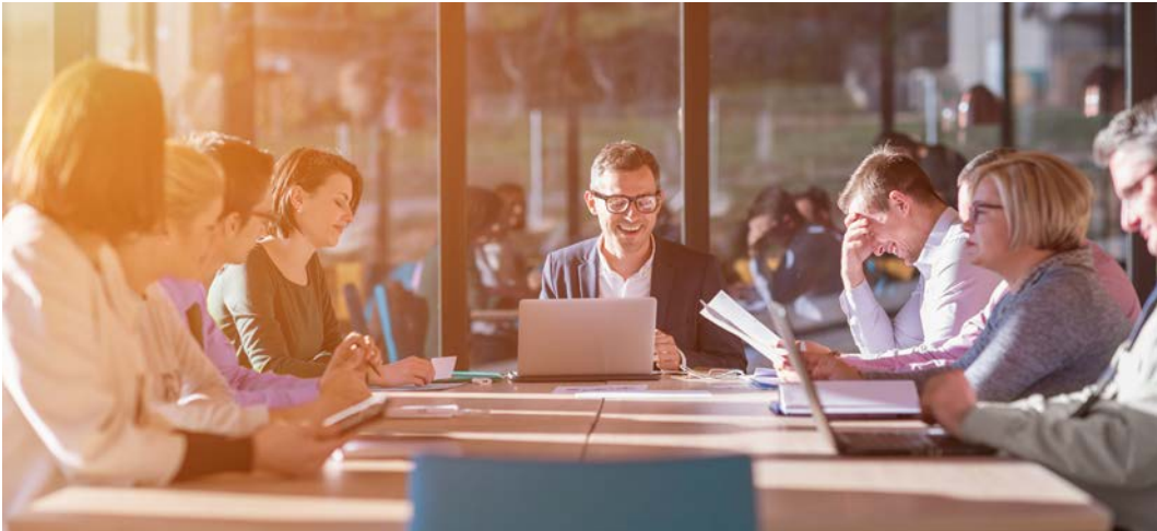
Görsel 1.1: Toplantı hâlindeki katılımcılar

Toplantıların düzenlenmesinin birçok nedeni vardır. Katılımcıların bilgi sahibi olmalarını sağlamak, farklı düşünce ve önerilerin ortaya konmasına zemin hazırlamak, üyeler arasında birlik ve beraberliği teşvik etmek bu nedenlerden bazılarıdır (Görsel 1.1). Ayrıca toplantılar; iletişim kurmak, yaratıcı fikirler üretmek ve dolaylı olarak eğitim yapmak gibi amaçlarla da yapılır.