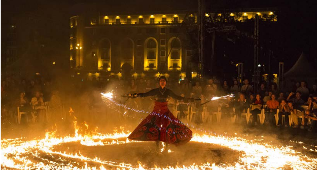
Görsel 2.4: Uluslararası Sokak Tiyatrosu Festivali, Bükreş / Romanya

Festivaller ve yarışmalar, yerel olarak düzenlenebileceği gibi ulusal veya uluslararası kapsamda da düzenlenebilir (Görsel 2.4).