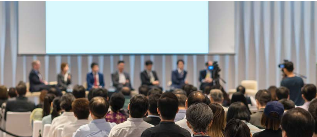
Görsel 2.9: Söyleşi veya panel