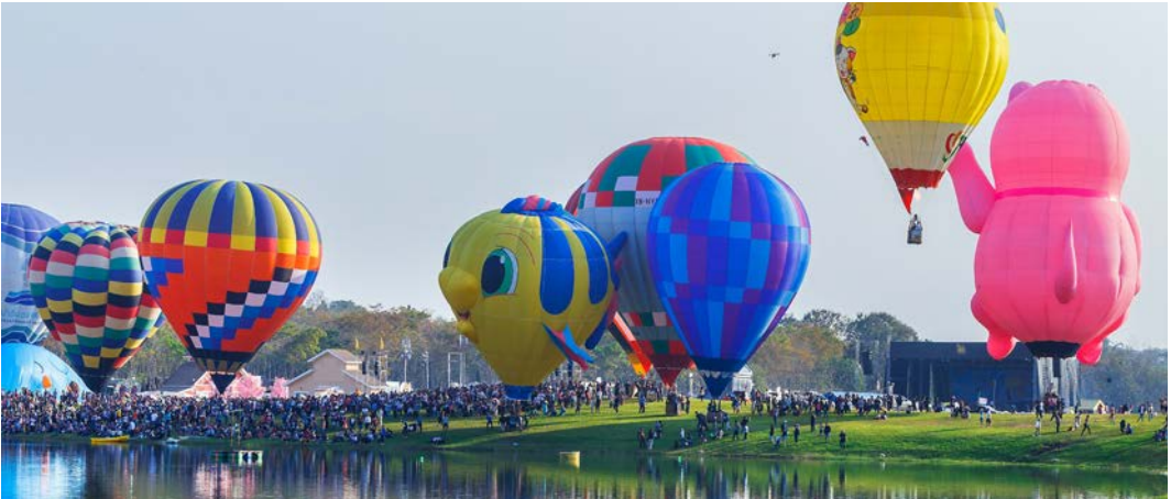
Görsel 2.10: Uluslararası Sıcak Hava Balonu Festivali, Tayland

Örneğin Japonya'daki Gion Matsuri, geleneksel kıyafetler, süslenmiş geçit arabaları ve halk danslarıyla kültürel bir şölen sunar. İtalya'daki Venedik Karnavalı, tarihî maskeleri ve zarif kostümleriyle tanınır, katılımcılar geleneksel kıyafetlerle şehir sokaklarını renklendirir. Kore'deki Andong Maskeli Dans Festivali, geleneksel maskeler ve halk oyunları ile geçmişten günümüze uzanan bir sahne sunar. Hindistan'daki Diwali Işık Festivali ise ışıklarla süslenen şehirleri ve coşkulu kutlamalarıyla benzersiz bir deneyim yaratır. Son yıllarda Nevşehir, Tayland ve Malezya gibi yerlerde düzenlenen sıcak hava balonu festivalleri, gökyüzünü süsleyen rengârenk balonlarla ziyaretçilere görsel bir şölen sunar (Görsel 2.10).