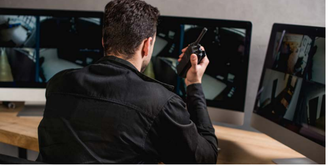
Görsel 2.27: Güvenlik çalışanı ve kameralı güvenlik önlemleri

güvenlik ekibi ve eylem planı doğrultusunda sürecin tüm aşamalarının sorunsuz şekilde ilerlemesi sağlanmalıdır. Kafilelerin güvenliği, spor alanlarının güvenliği, trafik güvenliği tüm bu çalışmaların kapsamında titizlikle sağlanmalıdır (Görsel 2.27).