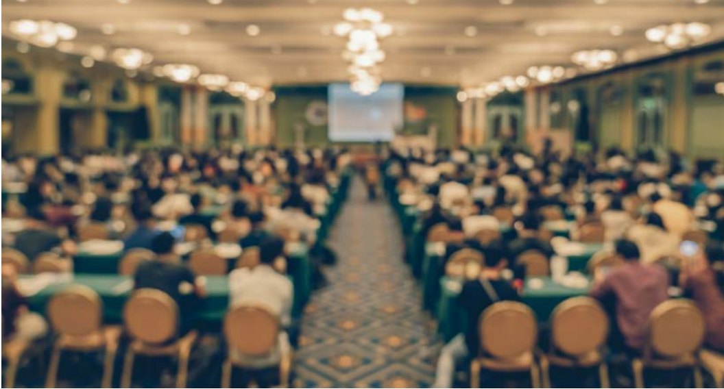
Görsel 2.35: Kalabalık bir etkinlik salonu