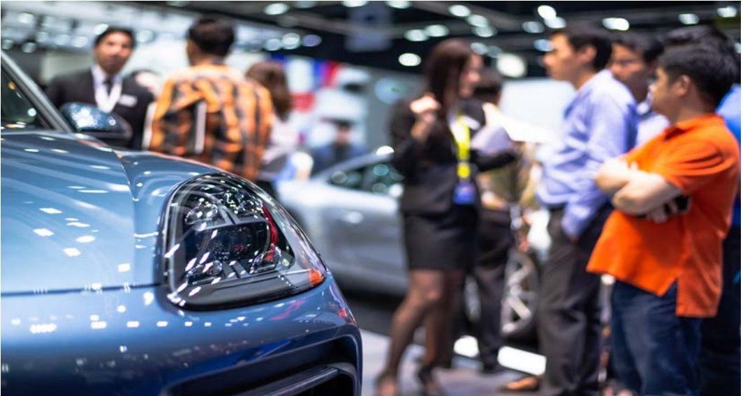
Görsel 2.1: Toplantı hâlindeki katılımcılar

Otomotiv Fuarları: Otomobil üreticileri, otomotiv profesyonelleri ve tüketicilerin buluştuğu etkinliklerdir (Görsel 2.1). Örneğin İstanbul Otomobil Fuarı gibi uluslararası etkinlikler, yeni araç modellerinin tanıtıldığı, sektördeki son eğilimlerin sergilendiği önemli platformlardır.