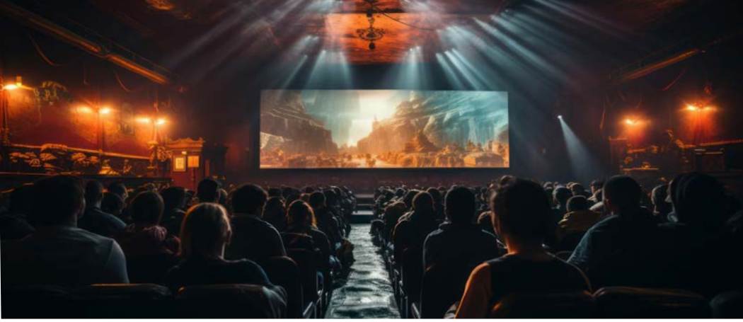
Görsel 2.8: Film festivali