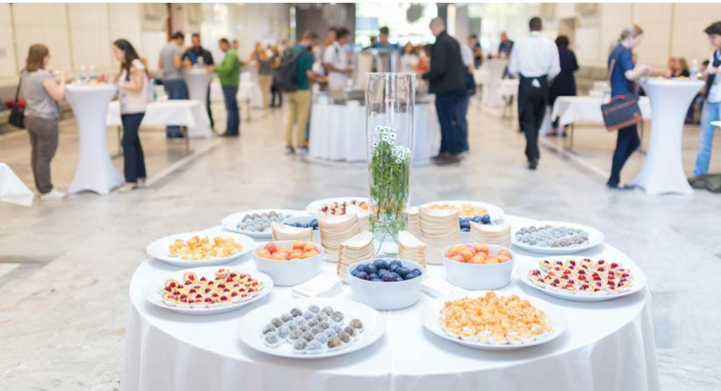
Görsel 1.8: Toplantı arası fuaye alanı, yiyecek ve içecek ikramı