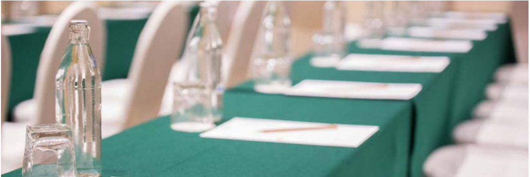
Görsel 1.3: Toplantı için hazırlanmış masa düzeni

Toplantılar; amaç, konu, yer, katılımcı sayısı ve düzenlenme sıklığına göre gruplara ayrılabilir. Bu sınıflandırma, toplantının niteliğinin daha iyi anlaşılmasına yardımcı olur (Görsel 1.3).