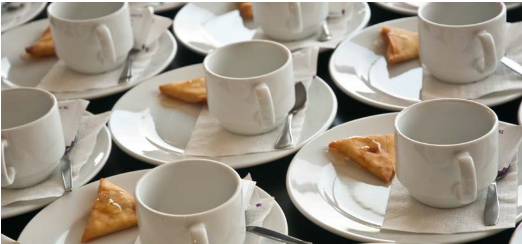
Görsel 2.34: Toplantı içecek servisi hazırlığı