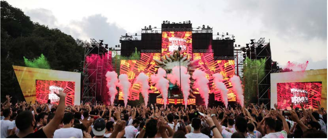
Görsel 2.7: Müzik festivali, İstanbul

Festivaller ve yarışmalar, düzenlenen bölgedeki ülke ya da bölgenin değerli yönlerini belirli bir süre için sahneye koyan etkinliklerdir. Belirli bir konu üzerine düzenlenir. Film festivali veya yarışmaları, kostüm festivali, müzik festivali veya yarışmaları (Görsel 2.7), dans festivali veya yarışmaları, domates festivali, içecek festivali vb.