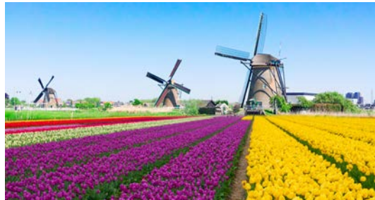
Görsel 2.6: Lale festivali, Hollanda