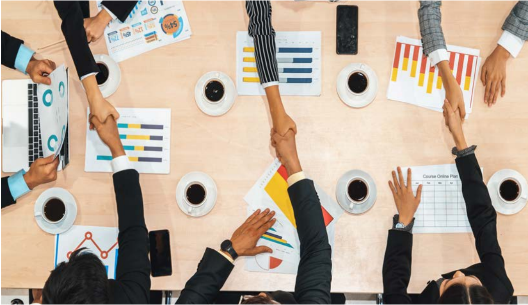
Görsel 2.18: Toplantı

Farklı kültürlerden gelen insanlar arasındaki etkileşim, daha kapsayıcı çeşitli iş dünyası anlayışlarının gelişmesini sağlar bu şekilde yabancı ortaklıklar ve iş birlikleri kurulabilir (Görsel 2.18).