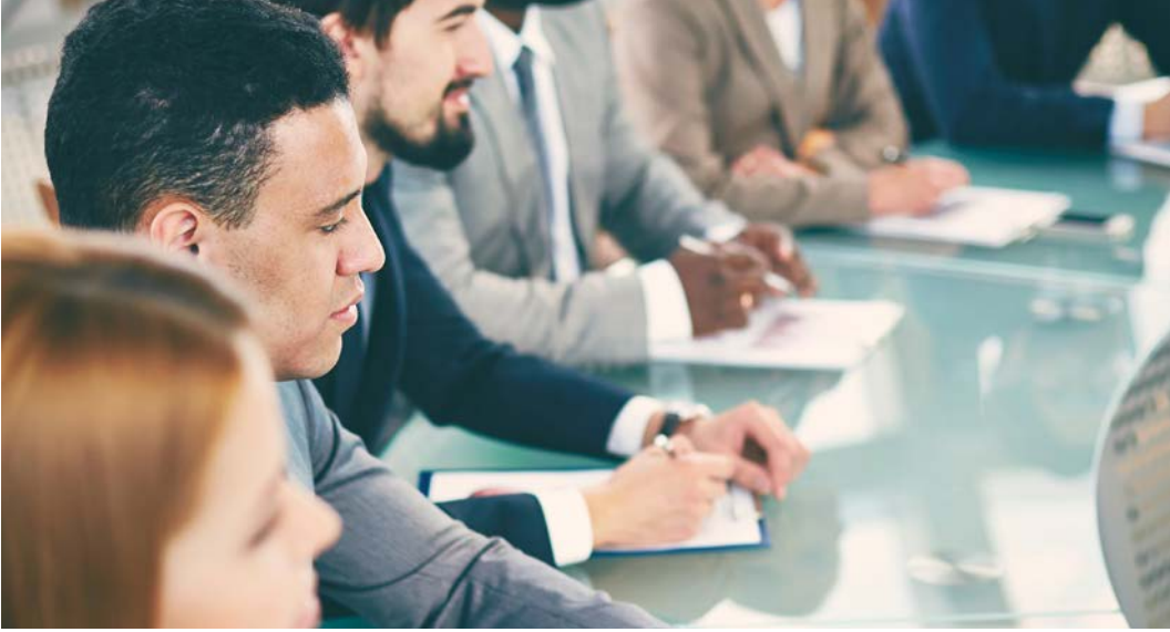
Görsel 2.36: Değerlendirme toplantısı

Finansal Durumun Analizi: Kongre organizasyonunun finansal durumu değerlendirilirken şu sorulara yanıt aranır: