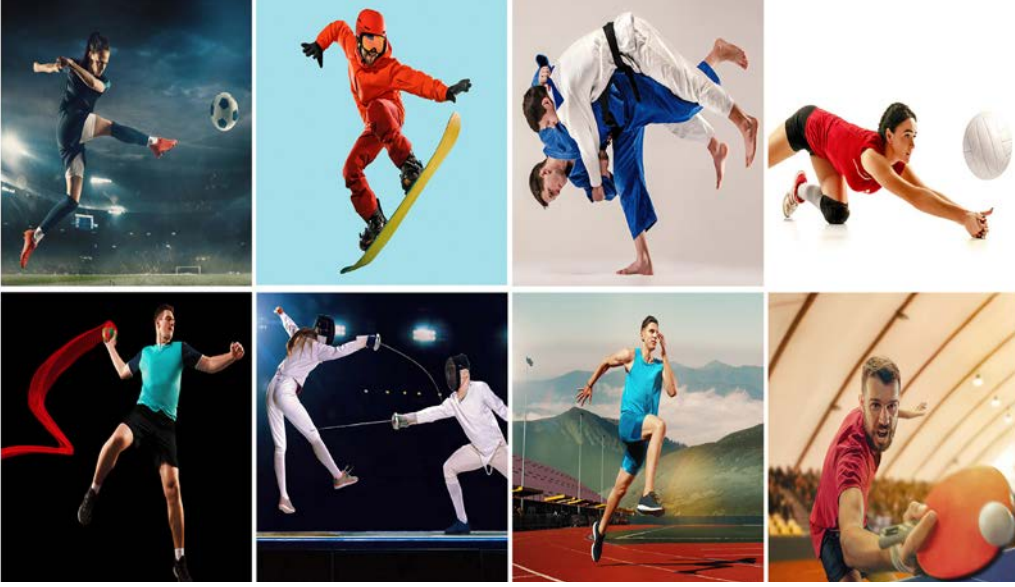
Görsel 2.23: Çeşitli spor dalları

seyirci, gazeteci, idareci ve diğer katılımcılar ile geniş bir topluluğu kapsamaktadır (Görsel 2.23).