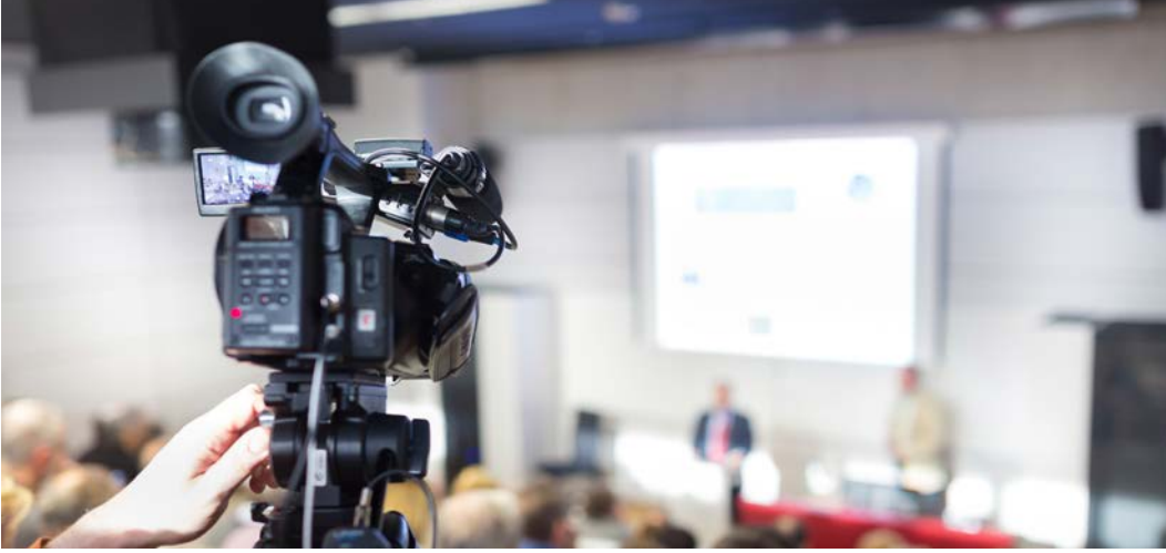
Görsel 1.7: Toplantı kaydı için kullanılan kamera