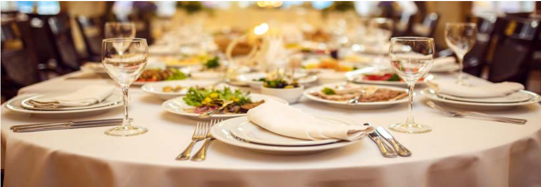
Görsel 2.22: Gala yemeği

Yiyecek ve İçecek Çeşidini Planlama: Katılımcılara özel bir menü belirlenebilir. Gala yemeği düzenlenecek ise konuklara buna uygun bir menü sunulmalıdır (Görsel 2.22).