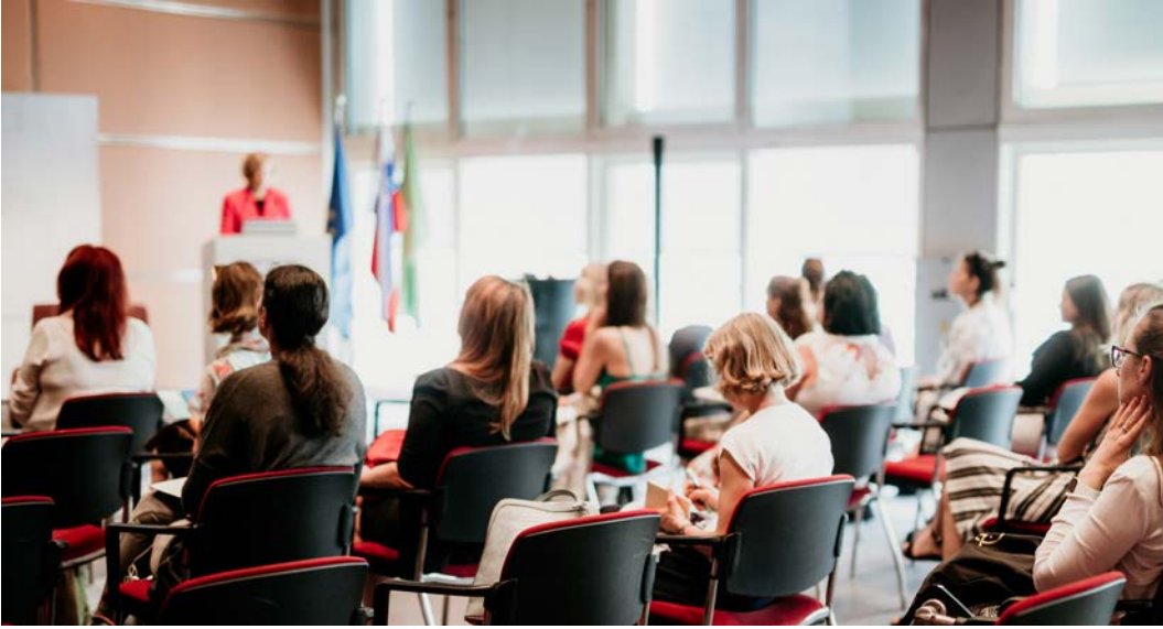
Görsel 2.28: Toplantı

Konaklama işletmelerinde toplantı ve kongre organizasyonu; oteller, tatil köyleri ve konferans merkezleri gibi konaklama tesislerinin iş dünyası, akademik çevreler veya çeşitli gruplar için düzenlediği etkinliklerin planlanması, koordinasyonu ve yürütülmesi sürecini kapsar. Bu tür organizasyonlar genellikle profesyonel toplantılar, seminerler, eğitim programları, çalıştaylar, fuarlar veya büyük ölçekli kongreler vb. etkinlikleri içerir (Görsel 2.28).