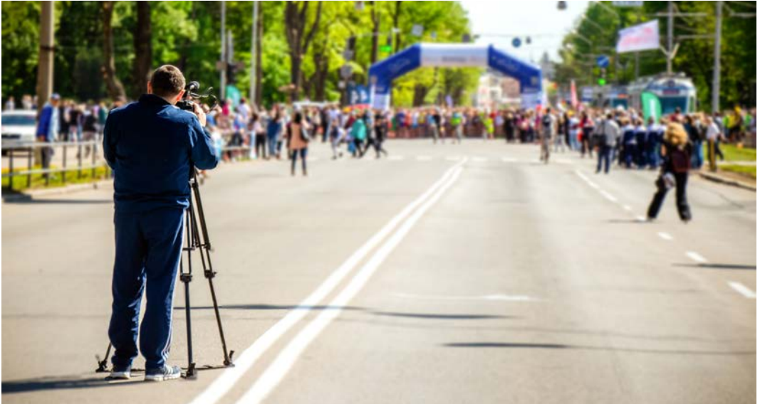
Görsel 2.26: Maraton yarışında yayın yapan basın çalışanları

Organizasyonlarda ayrıca basın yayın kuruluşlarının rahatça çalışabilmesi için her türlü alan, teknik donanım ve kapasitenin de hazır olması önemlidir. Özellikle uluslararası organizasyonlar, basın yayın kuruluşları aracılığı ile dünyanın tüm ülkelerine ulaşmaktadır. Organizasyon için kurulacak medya merkezleri basın yayın çalışanlarının rahatça çalışabileceği ortamlar olarak hazırlanmalıdır. Teknik ve internet altyapısı çok iyi düzeyde çalışmalıdır (Görsel 2.26).