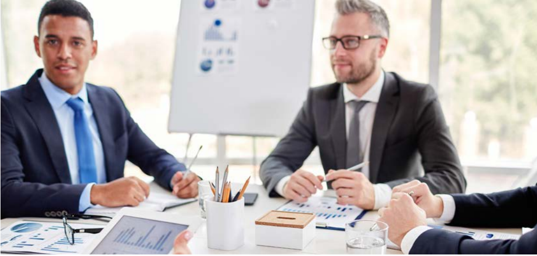
Görsel 1.2: Toplantı öncesi planlama çalışması

Planlama Toplantıları: Bir kuruluşun kısa, orta ve uzun vadede ulaşmak istediği hedefleri belirlemek için düzenlenir (Görsel 1.2).