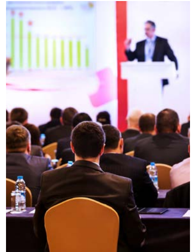
Görsel 2.17: Bayi toplantısı

Bayi toplantıları sektörde faaliyet gösteren şirketler ile bayileri bir araya getiren önemli organizasyonlardır. Belirli bir konunun ilgili sektörlerle iletmesini sağlamak amacıyla sıklıkla toplantılar düzenlenmektedir. Büyük firmalar bayileri ile iletişimi geliştirmek, satışları ile ilgili bilgi vermek, yeni ürünlerini tanıtmak amacıyla toplantı organizasyonları yapmaktadır (Görsel 2.17).