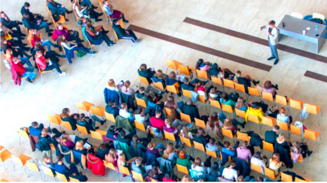
Görsel 1.6: Büyük bir salonda toplantı

Katılımcı Sayısı: Şirket toplantılarına genellikle 100'den az kişi katılır. Dernek toplantılarında bu sayı yüzlerle ifade edilir (Görsel 1.6).