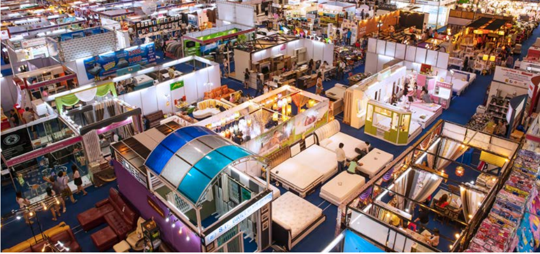
Görsel 1.5: Fuar alanı

Sergi ve Fuar: Ürün veya hizmetlerin belirli bir alanda topluca sergilenildiği genellikle hem profesyonellerin hem de halkın katılımına açık olan organizasyonlardır (Görsel 1.5). Bu tür etkinliklerde ürün ya da hizmet sunanlarla potansiyel alıcılar doğrudan iletişim kurma imkânı bularak ticari ilişkiler geliştirebilir. Bu nedenle sergi ve fuarlar, önemli bir pazar alanı olarak kabul edilir.