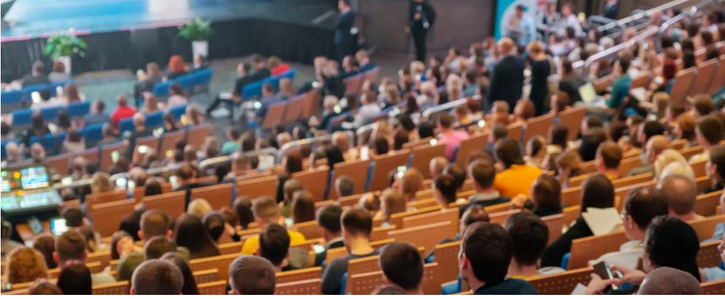
Görsel 1.9: Uluslararası kongre salonu

ulaştırma hizmetleri, bankacılık sektörü ve toplantı salonları gibi (Görsel 1.9) birçok unsur organizasyonun ayrılmaz bir parçasını oluşturur. Böylece kongre turizmi sektörü hem ekonomik hem de sosyal açıdan turizme önemli katkılar sunarak gelişmeye devam etmektedir.