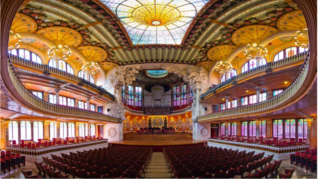
Görsel 2.13: Önemli bir konser salonu, İspanya

Görsel 2.13'te yer alan konser salonu, büyük ölçekli yetenek yarışmaları ve müzik temalı organizasyonlar için seçilen mekânların, etkinliğin prestiji ve katılımcı motivasyonu üzerindeki belirleyici rolünü yansıtmaktadır.