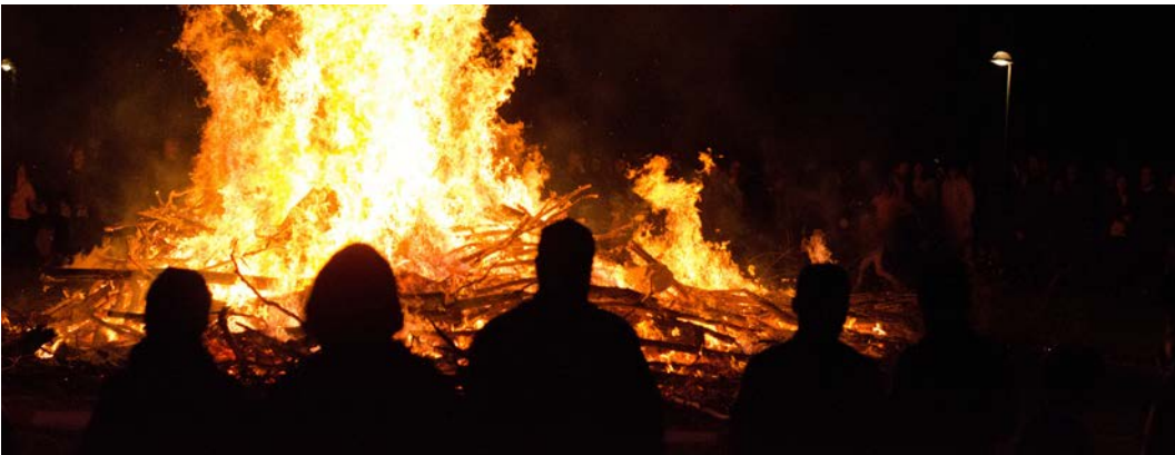
Görsel 2.16: Şenlik ateşi ile baharın gelişini kutlayan insanlar

Sonuç olarak festival ve yarışmalar turizm sektörüne ekonomik ve sosyal açıdan çok yönlü katkı sağlar (Görsel 2.16). Bu organizasyonlar yerel ve ulusal ekonomik etkilerinin yanında kültürel etkileşimi ve toplumsal dayanışmayı da pekiştirir.