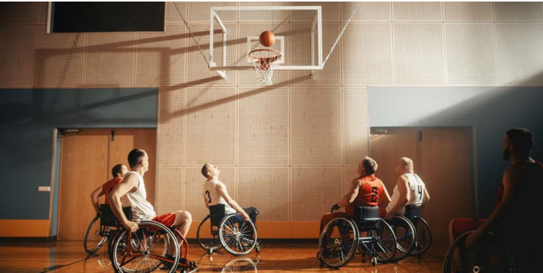
Görsel 2.25: Paralimpik bir spor organizasyonu

Konaklama planlaması yapılırken de dikkatli davranılmalıdır. Kafilerin konaklama planlarında kafilenin büyüklüğü, kafilenin istekleri aynı zamanda uluslararası bir organizasyon ise politik uluslararası ilişkilerdeki hassasiyet gibi konulara dikkat edilmelidir. Organizasyonun kimler için yapıldığı da konaklama planlamasında önem taşır. Örneğin paralimpik sporcuların katılacağı bir organizasyonda seçilecek tesisin konaklama ve ulaşım imkânları, engelli bireylerin rahat kullanımına uygun olmalıdır (Görsel 2.25).