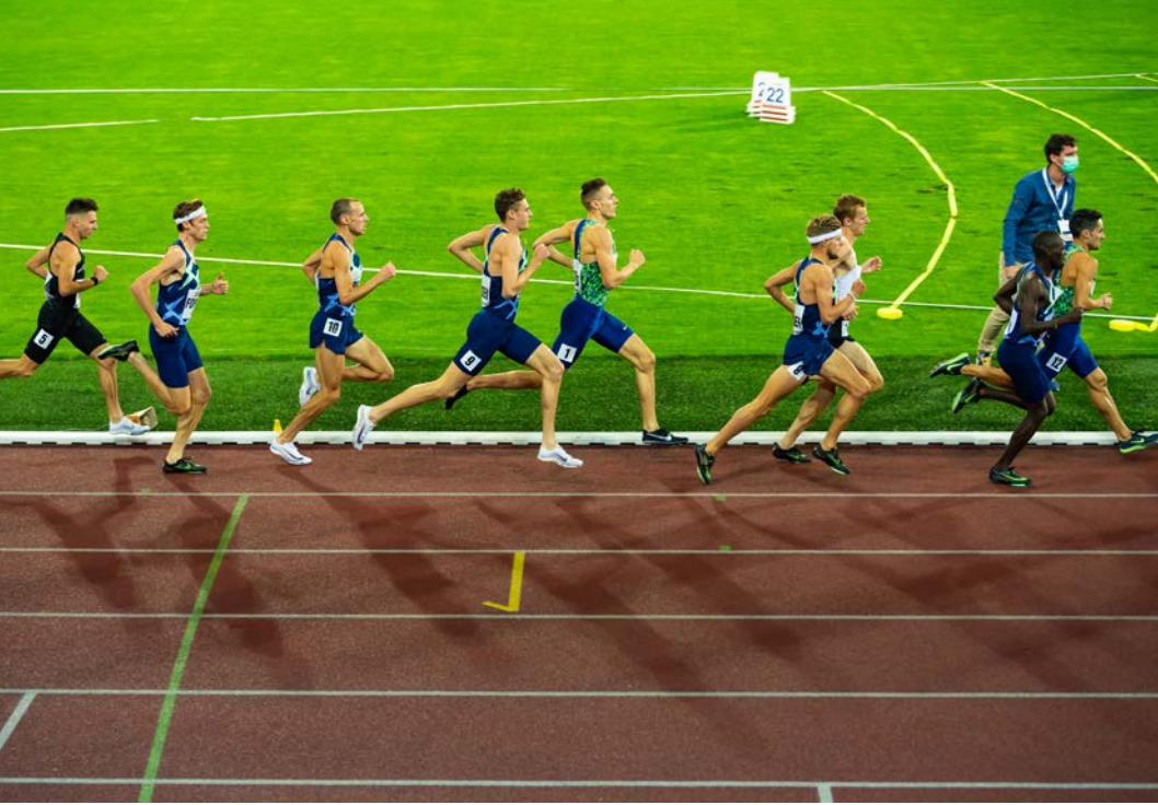
Görsel 2.14: Profesyonel atletizm yarışması, Tokyo

Düzenlenen yarışmalar, bireylerin ya da grupların kendilerini kanıtlamaları ve uluslararası düzeyde gelişmeleri için önemli etkinliklerdir (Görsel 2.14). Ev sahibi ülkenin uluslararası düzeyde kendini tanıtmasına olanak sağlar.