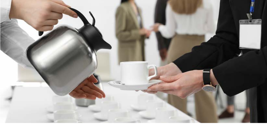
Görsel 2.33: Toplantı içecek servisi

Kongre turizminde yiyecek içecek hizmetleri; etkinliğin türüne, süresine, katılımcı sayısına ve organizasyonun bütçesine bağlı olarak çeşitlilik gösterir (Görsel 2.33). Profesyonel bir yaklaşımla planlanarak katılımcıların ihtiyaçlarını karşılamayı, aynı zamanda etkinliğin genel atmosferini desteklemeyi amaçlar. Gıda güvenliği standartlarına uyulması kritik önem taşır. Ayrıca sunumun estetik ve profesyonel olması beklenir.