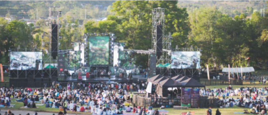
Görsel 2.12: Müzik festivali, İstanbul

Uluslararası yarışmalar ise dünya genelinde bireylerin, grupların ya da kuruluşların belirli alanlardaki becerilerini ve yeteneklerini sergilediği organizasyonlardır (Görsel 2.12). Bu yarışmalar farklı alanlarda düzenlenebilir. Bilimsel, sportif, sanatsal ve teknolojik, yiyecek alanında vb. birçok alanda olabilir.