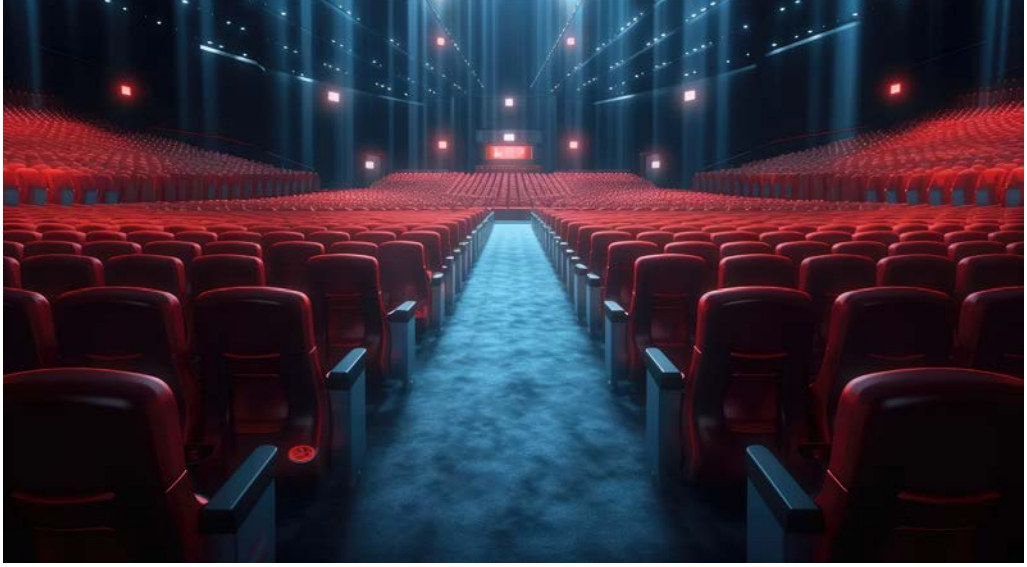
Görsel 2.15: Büyük etkinlikler için kongre salonu

Etkinliklerin düzenleneceği mekânlar, katılımcı sayısına ve etkinliğin içeriğine göre seçilmelidir (Görsel 2.15). Büyük kapsamlı etkinliklerde ulaşım, güvenlik, sağlık, altyapı ve konaklama tesisleri gibi yardımcı unsurlar da kritik öneme sahiptir ve iyi planlanmalıdır. Tüm bu unsurların tamamlanması iyi oluşturulmuş bir yönetim ekibi ile mümkün olur. Aksi takdirde çıkabilecek sorunlar ülkeler arası krizlere yol açabilir. Etkinlik programı ve zaman akışı detaylı şekilde hazırlanmalıdır.