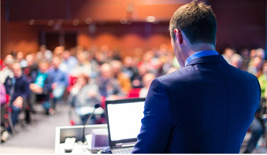
Görsel 2.21: Bilgisayar ile sunum yapan katılımcı

Gerekli Ekipmanı Belirleme: Şirketlerin bayileri ile yapacağı toplantılarda hangi ekipmanları (bilgisayar, mikrofon, projeksiyon vb.) kullanacağı önceden belirlenmelidir (Görsel 2.21). Eksik ekipmanlar toplantı tarihine kadar tamamlanmalıdır.