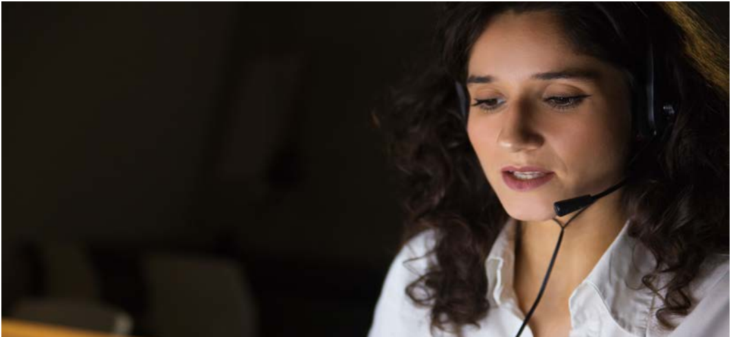
Görsel 2.32: Simultane tercüman