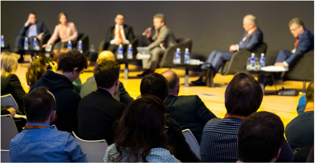
Görsel 1.4: Panel konuşmacıları ve katılımcılar

Panel: İki ya da daha fazla konuşmacının uzmanlık alanlarında görüşlerini savunduğu toplantılardır (Görsel 1.4). Bu tartışmalar panel yöneticisi tarafından yönetilir. Konuşmacılarla birlikte dinleyicilerin de tartışmasına açıktır. Dinleyiciler tartışmaya katılırsa forum adını alır.