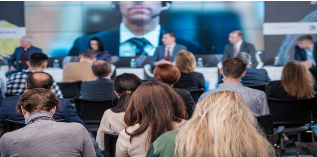
Görsel 2.20: Birden fazla konuşmacının yer aldığı toplantı

Program ve İçerik Hazırlığı: Etkinliğin akışını belirlemek için detaylı bir program oluşturulmalıdır. Organizasyon düzenleyen firma, içerik ve program için toplantıyı düzenleyen sektör temsilcisi ile detaylı görüşme sağlamalıdır. Program içinde konuşmacılar, sunum içerikleri ve tartışma konuları özenle seçilmelidir (Görsel 2.20). Katılımcılara yönelik bir program içeriği hazırlanmalıdır.