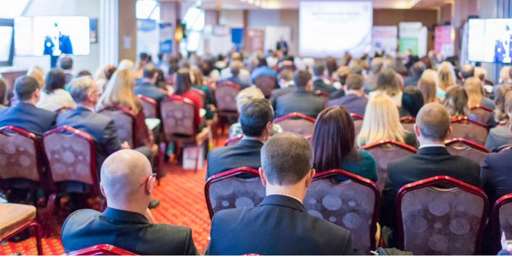
Görsel 2.19: Sunum izleyen katılımcılar

etkinlikler için donanımı fazla olan mekânlar tercih edilmelidir. Şirketler bayi toplantısı için belirli bir tema belirleyebilir (Görsel 2.19). Toplantının yaz döneminde deniz kenarında bir konaklama işletmesinde ya da kış döneminde daha sıcak bir ülkede düzenlenmesi istenebilir.