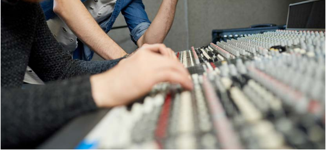
Görsel 2.31: Toplantı salonu ekipman paneli